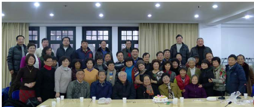
花甲年师生合影照