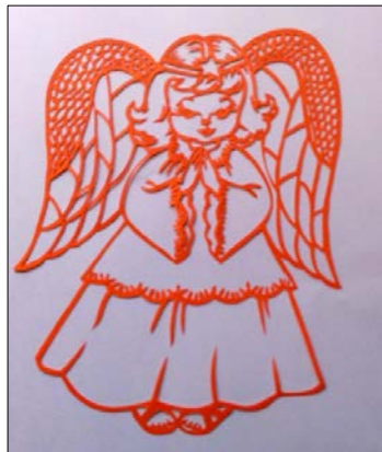
图 3 小天使

惬意。夏季，圣诞前，她总是插上塑料翅膀，扮成小天使模样，象煞有介事，极其可爱和惹人喜爱。于是灵感一现，就有了〈女孩在花园〉和〈小天使〉两件剪纸。(见图 2，图 3)