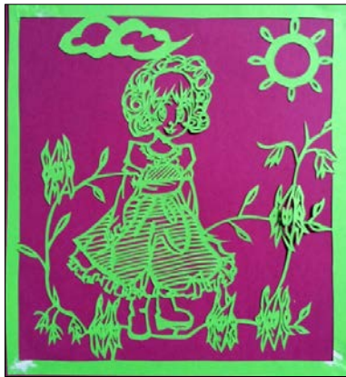
图 2 女孩在花园

阿德莱德最让人动心的是有着漂亮的住宅并带着花园。没有称之为“水泥森林”的高楼大厦那种压抑感，更没有那种热带效应。倒是让人视野开阔，心旷神怡。我与邻居家共有一座围墙，有一样的前后花园，草坪，早晨我在后花园的草坪上打太极拳，邻居家的女孩在后花园里采花，追逐蝴蝶，嬉戏，好不自在与