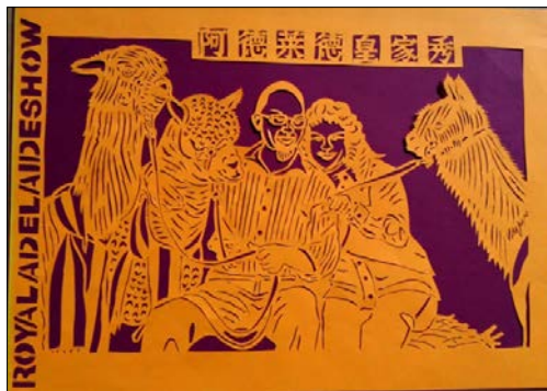
图 1 阿德莱德皇家秀

今年的明星宠物是羊驼 (ALPACA)。羊驼原产于亚马逊河上游海拔 3000M-6500M 的安第斯山脉的秘鲁中部，曾广泛分布于南美大陆。近十年来，澳洲采用引进和培育的方法，将羊驼发展到现在的 10 多万头。羊驼有一个长颈，头似骆驼，鼻梁隆起，两耳竖立，颈细长，无驼峰，体长 200cm 左右，平均肩高 90-100cm。不会鸣叫，只能发出低沉的“吭吭”声。羊驼细密而厚的皮毛既可御寒，又可挡住过分的太阳辐射。脚有趾，掌有球头型角质上皮组织，但小而不负重。羊驼有定点排泄的习惯。